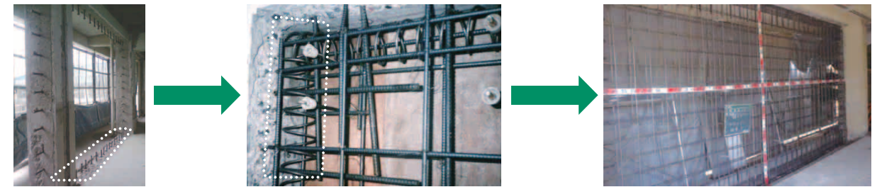
あと施工アンカー筋の打設

建築物の強度向上、偏心率・剛性率の改善を行うための補強方法。既存の柱・大梁にあと施工アンカー筋を打設した後、スパイラル筋・壁筋で補強します。